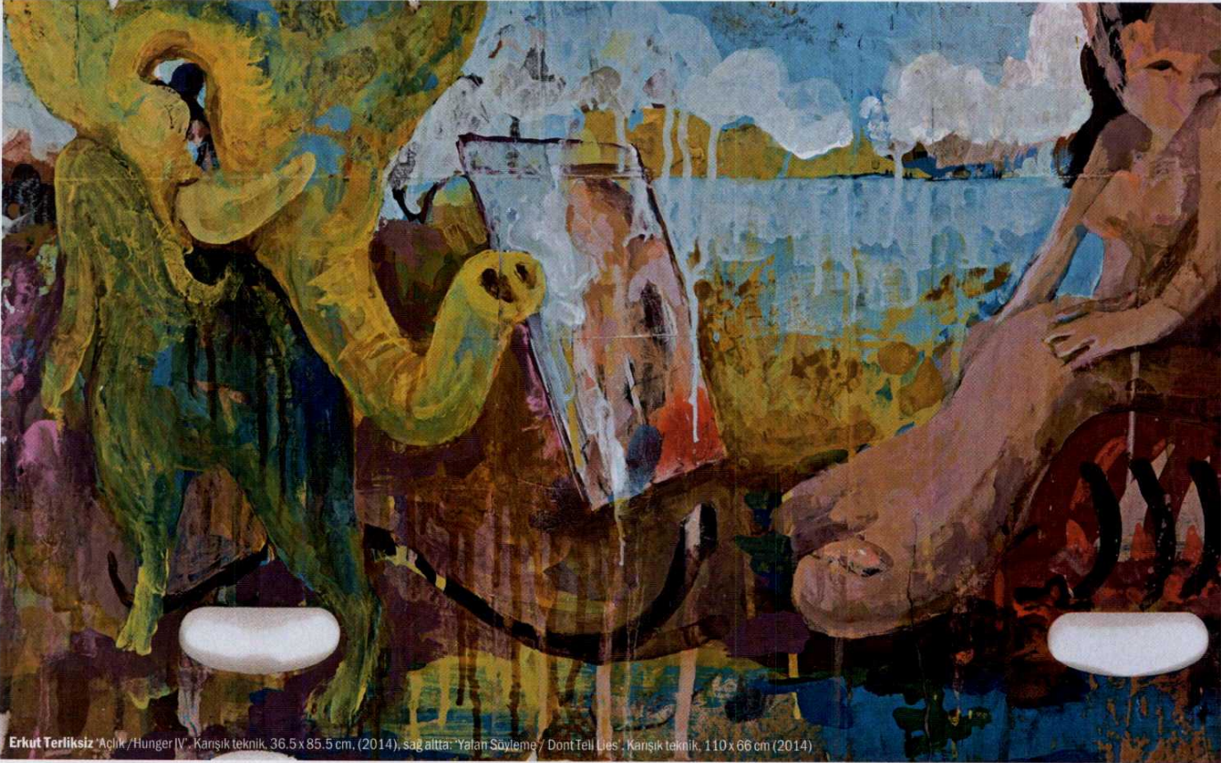
Erkut Terliksiz 'Açlık / Hunger IV', Karışık teknik, 36.5 x 85.5 cm, (2014), sağ altta: 'Yatan Söyleme / Dont Tell Lies', Karışık teknik, 110 x 66 cm (2014)

Etrafımızdaki tuhafılıklara resimlerinde ilk bakışta çocuksu görünen bir yaklaşım ve gerçekçi hikâyeler ile dikkat çeken Erkut Terliksiz'in dördüncü solo sergisi 'Açlık' bu ay x-ist'te açılıyor. Antoine Remise sergi hazırlıkları devam ederken Terliksiz ile atölyesinde buluştu.